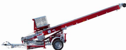
Emminghaus Pionier-Aufzug HDB Flexibel und universell einsetzbar!