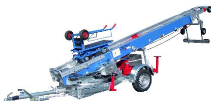
Emminghaus Pionier-Aufzug HDBK Meistert jede Herausforderung!