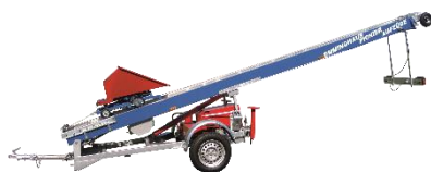
Emminghaus Pionier-Aufzug H Grundmodell mit TOP-Ausstattung!

□ = nicht vorhanden ✓ = serienmäßig ■ = optional * = Aufpreis f. höhere Traglast